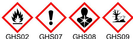
GHS02 GHS07 GHS08 GHS09